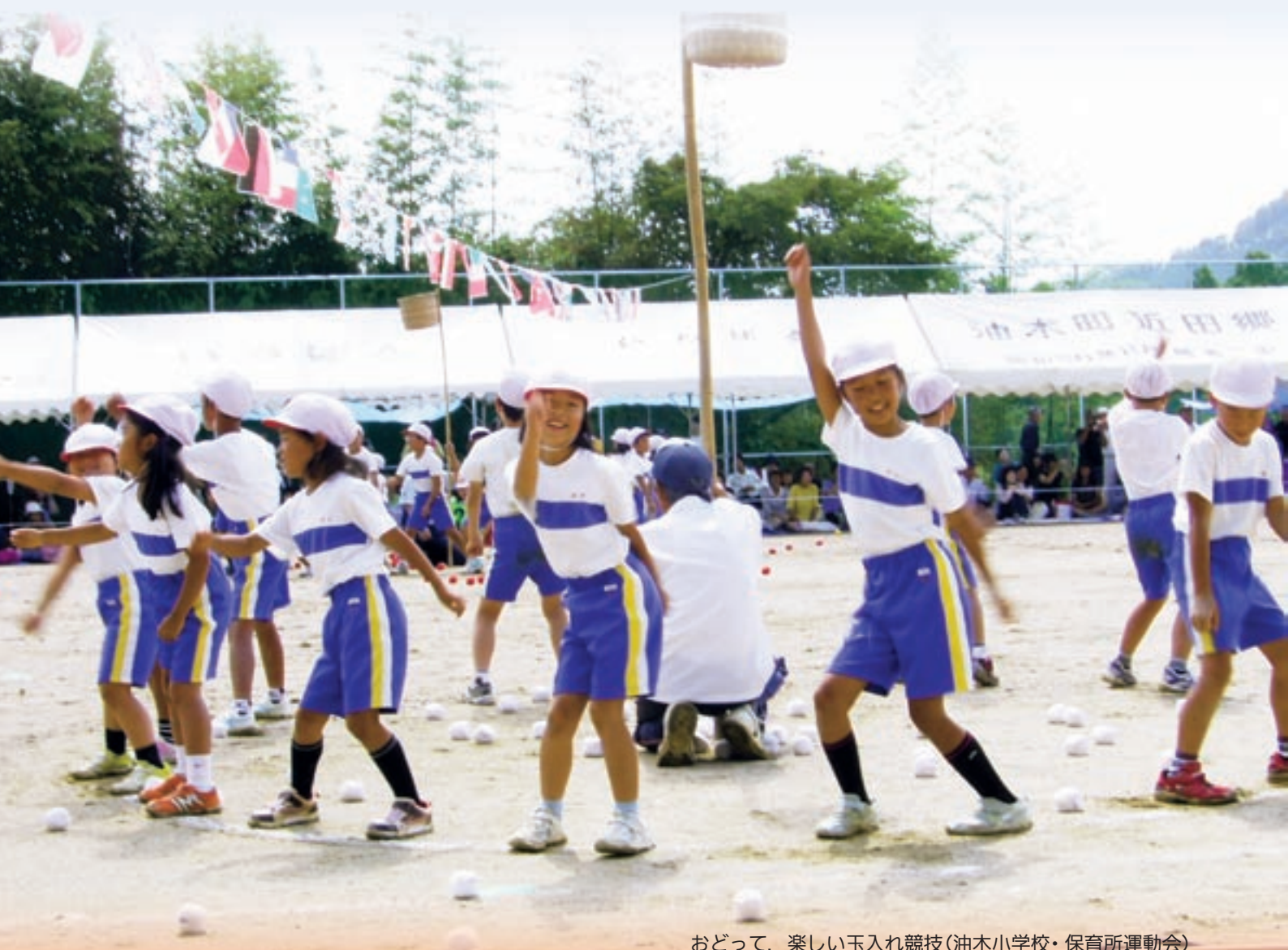
おどって、楽しい玉入れ競技(油木小学校・保育所運動会)