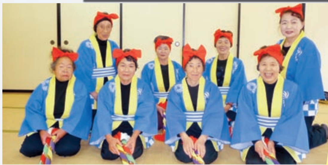
下豊松長寿老人会 文化部の皆さん