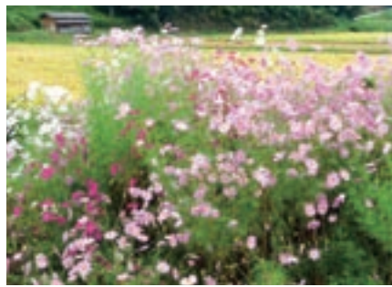
秋を告げるコスモス

《個人情報取り扱いについて》 ご記入いただきました個人情報、賞品発送および『まちの声』などの目的以外には利用いたしません。