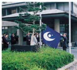
神石支所での町旗掲揚