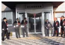
本庁舎玄関前での銘板除幕