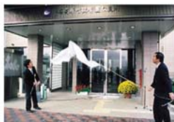
豊松支所での銘板除幕