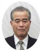
教育長 川崎 勝則 (12月24日付)