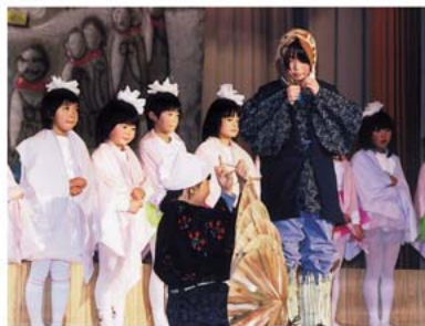
昨年の中央公民館まつり