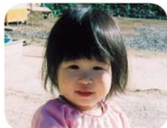
みず 里 瑠ちゃん (小晶) ☆親の願い 素直で優しく誰からも愛される女性になってください。