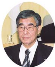
町長 牧野 雄光