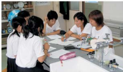
楽しい交流会でした

生徒と研修生は、言葉の壁を越えたコミュニケーション が図れ、生徒たちは日頃体験することの出来ない貴重な 体験をすることが出来ました。