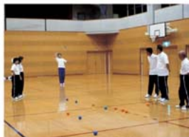
インドア・ベタンク

六月八日(水)、体育指導委員が、今秋に予定のニュースポーツ講習会に向け、インドア・ベタンクとミニテニスの講習を行いました。次体育指導委員は、次の十六人です。