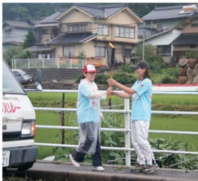
雨の中走り継ぎました