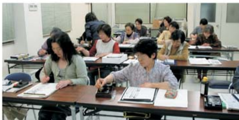
一緒に書道をしませんが