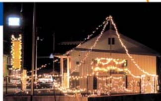
駐在所のイルミネーション

夏の一夜を過ごして頂くのではないでしようか。 これからは、相渡に住んで良かったと皆が思えるような地域づくりに、区民一緒になって取り組んでいきたいと願っています。