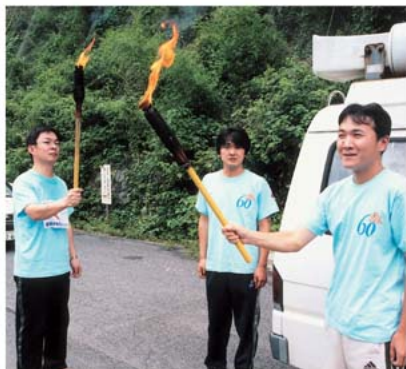
庄原市東城町へバトンタッチ

7月4日(月)～5日(火)の2日間、神石高原町で反核平和の火がリレーされました。45名のランナーが、町内を平和への願いを込めて反核平和の火をリレーしました。4日は降り続く雨の中で府中市上下町から引き受け、翌5日には、庄原市東城町へ無事リレーする事ができました。平和の火リレーは、広島県全市町を878区間、1,015.3kmを多くのランナーによって走り継がれます。