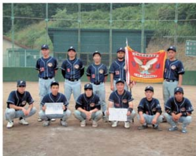
優勝したファイターズ

優勝したファイターズ は、8月21日(日)神 石高原町野球大会に出 場されます。