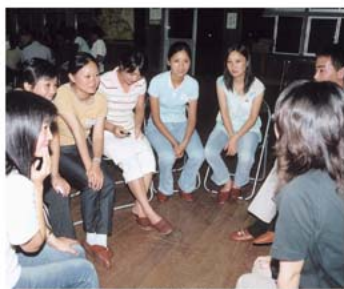
楽しいひと時を過ごしました

八月十七日（水）、ながの村で、中国から研修に来ている、十代から三十代の女性たちと、神石高原町青年会のメンバーとの交流会が行われました。数人ずつのグループに分かれて、自由なテーマで質問や会話、交流をしました。