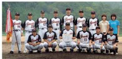
優勝したオックス