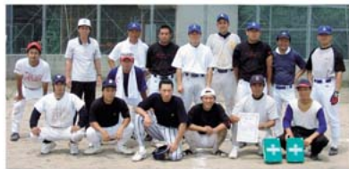
優勝した三和体協