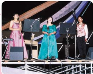
夕日の沈む中、歌声と演奏で観客を魅了したノイアーヴィント

また芝生広場では、商工会青年部による露店もあり、来場された方は夏の涼しい夜を満喫されました。