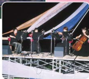
芳醇な香り漂う大人の弦楽カルテット