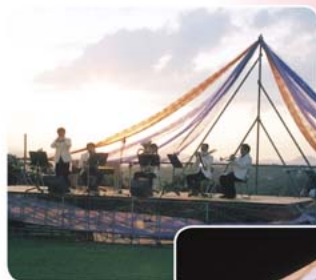
◀ 力強く元気な演奏のNTT西日本中国吹奏楽クラブ