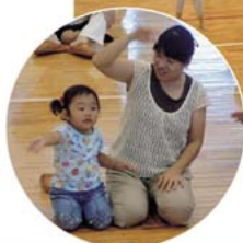
みんなで楽しく 過ごしたよ