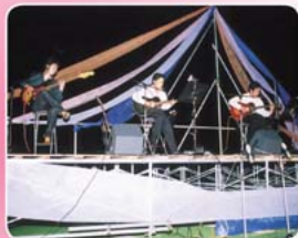
◀ 会場を騒がした(?) 3人の地元バンド オーバードライブ