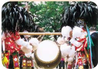
鶴岡八幡神社秋の例大祭 有木…Yさん撮影