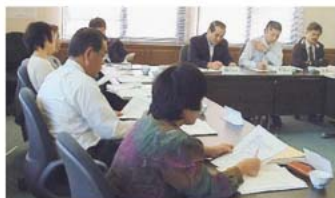
策定委員会の会議風景

これらの計画策定にあたっては、学識経験者等で構成する委員の意見やアンケートの調査結果を基に高齢者数、要介護認定者数、介護保険料及びその他サービスの見直しなどについて協議しています。