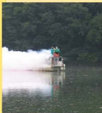
湖水まつり遊覧船(14日に開演記事)