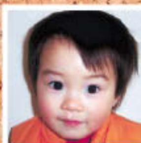
八軒 涙大ちゃん (高 鷲)