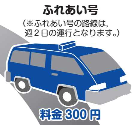
ふれあい号 (※ふれあい号の路線は、週2日の運行となります。)