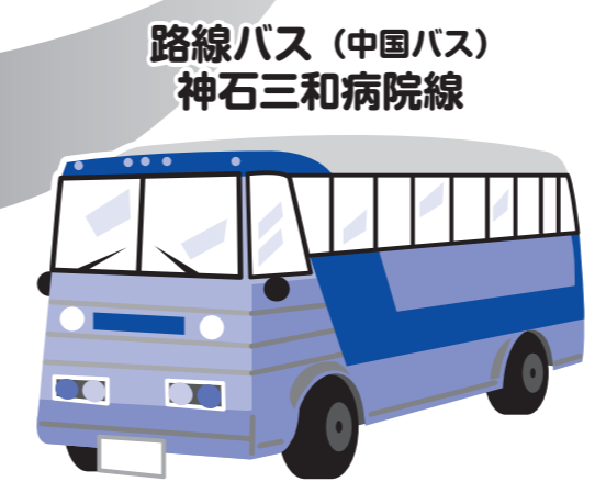
料金 300円 (割引前 810円)