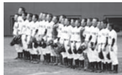
試合終了後校歌を歌う野球部ナイン

2回戦三原高校戦は7月18日尾道しまなみ球場で行われました。この試合も2点を先制され苦しい立ち上がりとなりました。4回に1点を返しましたが、相手投手に要所を押さえられ3回戦進出はなりませんでした。