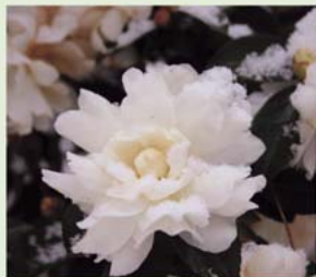
初雪で凍える山茶花

(今月の表紙) 夕方のウインズコートホテル。 薄暗い山の中で照明の幻想的な光がホテルを包みます。