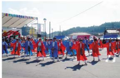
さんわふるさとフェア