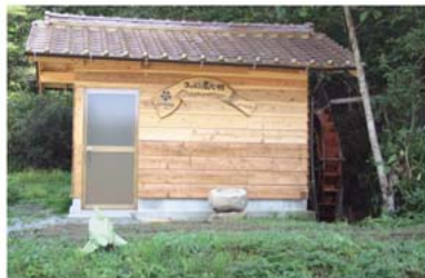
ええのう広石グループ 水車小屋