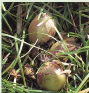
小さい春見〜つけた「ふきのとう」