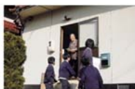
犯罪防止のお願いのチラシ配布