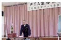
藤井警部補からの指導