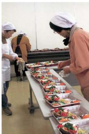
おいしそうな料理です