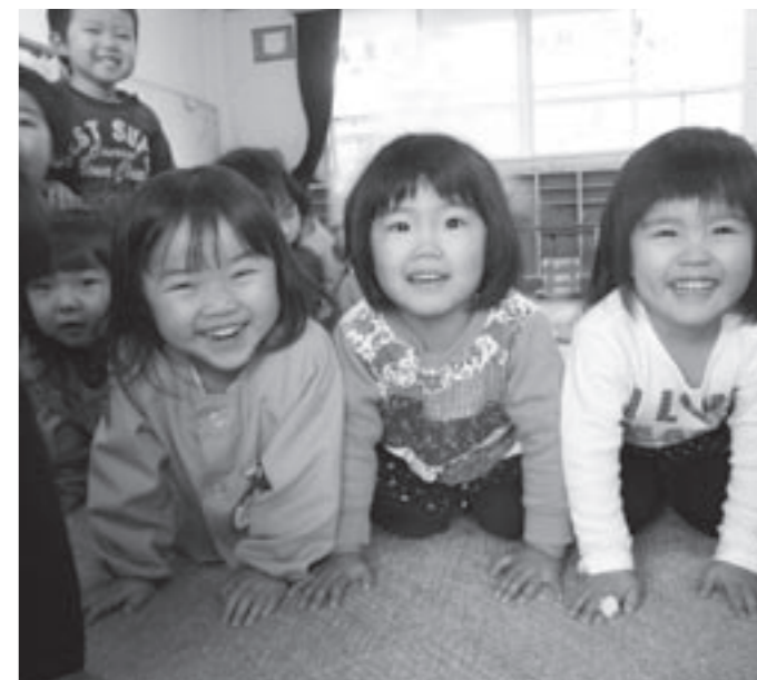
笑顔がかわいい子どもたち（小島保育所）