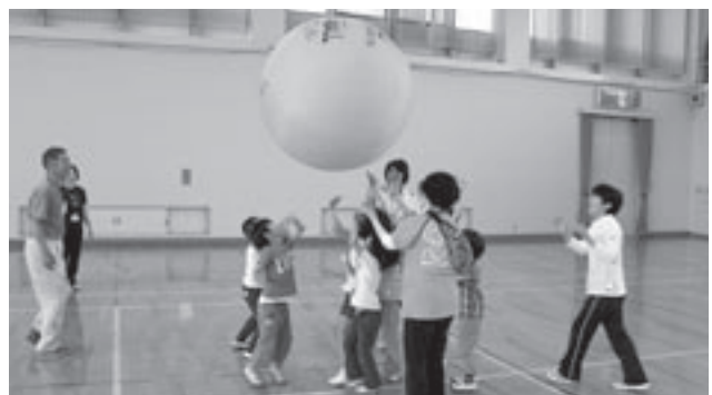
こんなに大きなキンボール

6月12日、豊松小学校で子どもの体力向上をめざし「おやこ元気アップ事業」が行われました。1年生から4年生約40名が親子で県レクリエーション協会の指導のもと「ネットボール」を体験しました。新しいスポーツに児童も保護者も一緒に楽しみ、さわやかな汗を流しました。