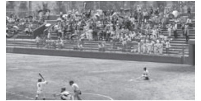
スタンドからの応援に選手がこたえました