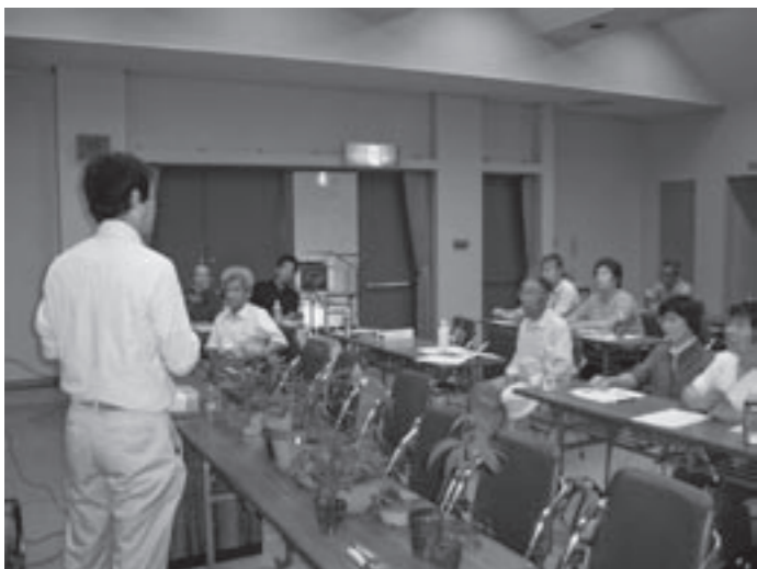
山菜倶楽部講演会