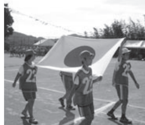
入場行進 油木小学校・保育所合同運動会