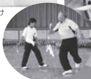
地元神楽団から舞を教わりました

町内には、国の重要文化財の指定を受けた多数の神楽道具があります。また県の無形文化財に指定されている「ハヶ社神楽」など類い稀に見る先人からの文化遺産が受け継がれています。これを子どもたちは「夢」として捉え、実現させました。神石高原町の素晴らしい伝統がここにまた継承されました。