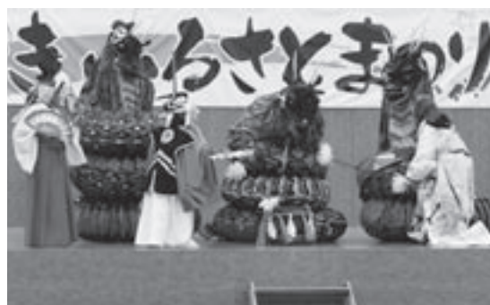
ゆきふるさとまつりでのお披露目