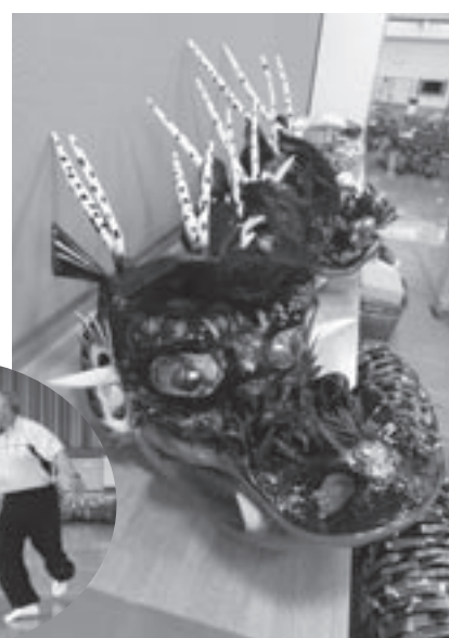
迫力あるオロチの頭

町内には、国の重要文化財の指定を受けた多数の神楽道具があります。また県の無形文化財に指定されている「ハヶ社神楽」など類い稀に見る先人からの文化遺産が受け継がれています。これを子どもたちは「夢」として捉え、実現させました。神石高原町の素晴らしい伝統がここにまた継承されました。