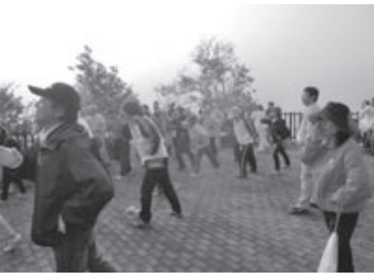
ヤッポーウォーキング