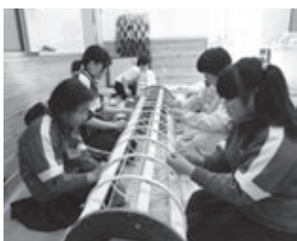
オロチの胴体の骨組み作り

児童らは神楽の歴史や物語を習い、油木神楽保存会の舞を鑑賞し、4月からオロチの制作に取りかかりました。7月には頭3体と18mに及ぶ胴が完成し、舞の練習を始めました。