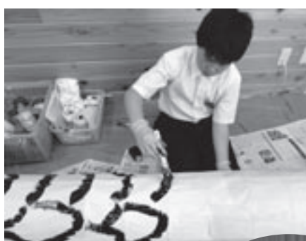
胴体も丁寧に色づけ