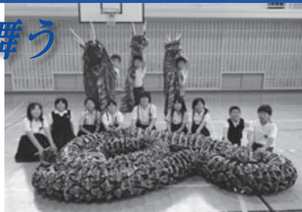
オロチついに完成!!

「自分達の手で世界一かっこいい大蛇を作りみんなで舞いたい」という油木小学校児童の「夢」が青少年育成広島県民会議の「夢配達人プロジェクト」に3,478件の応募の中から選ばれ、油木小学校5年生児童全員で「夢」へ向け始動しました。地域の方々の協力により、ついにこのお披露目の日を迎えました。