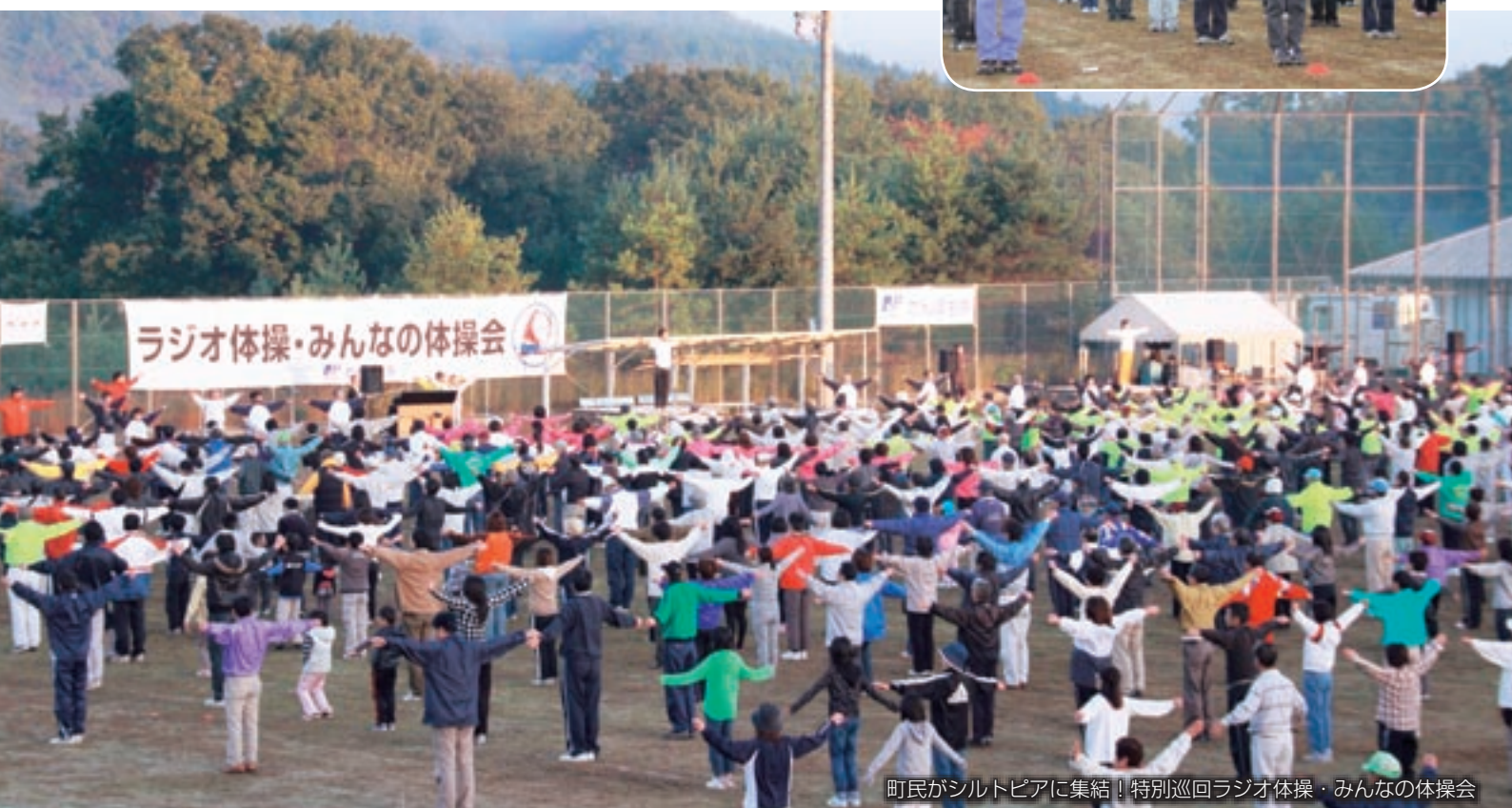
町民がシルトピアに集結！特別巡回ラジオ体操・みんなの体操会