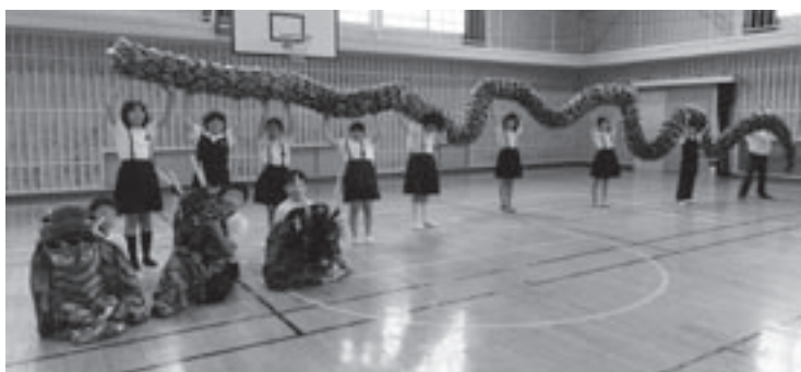
完成した胴体はこんなに長い