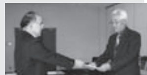
山本委員長(左)から山本委員長(右)へ答申書が渡されました

答申を受けて今後、教育委員会 で中高一貫教育への具体的方針を 決定していきます。