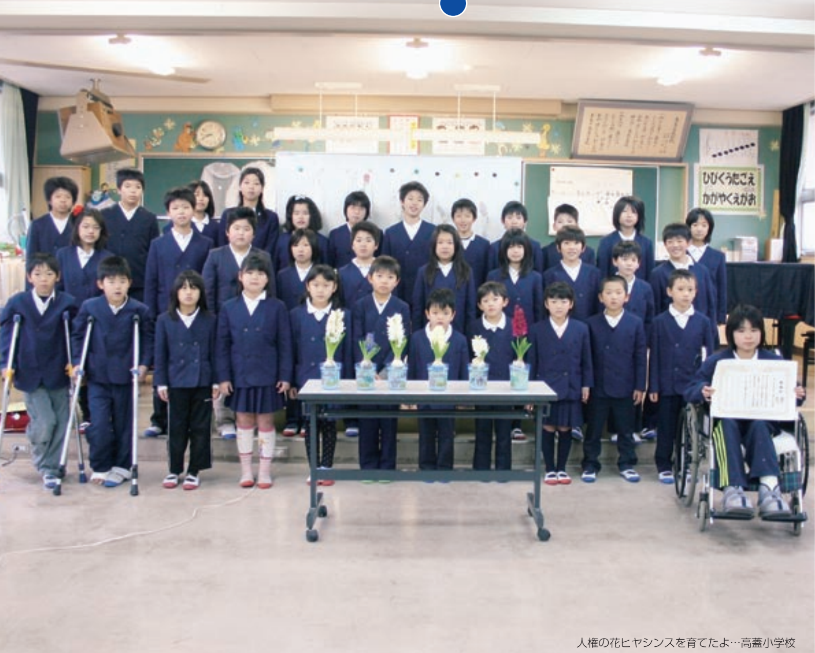
人権の花ヒヤシンスを育てたよ…高蓋小学校