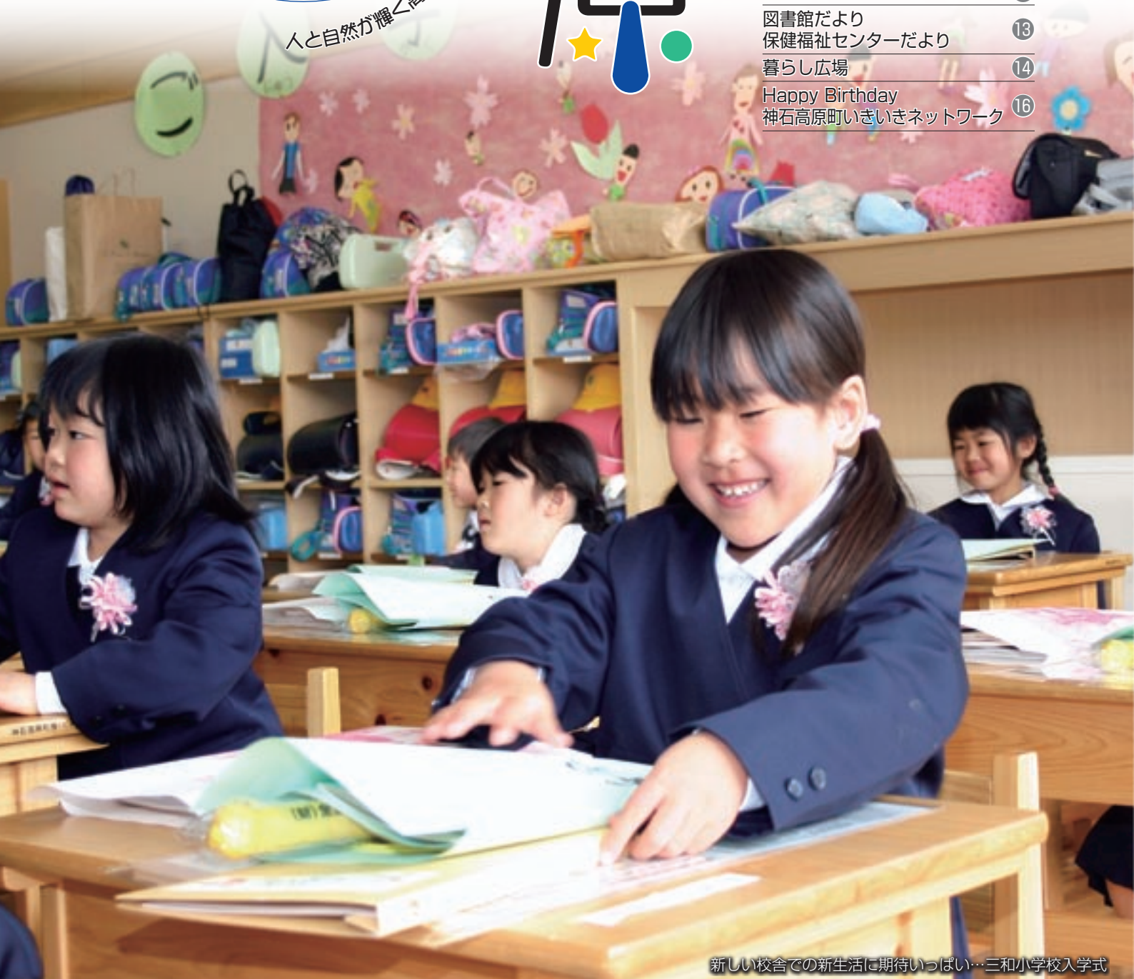
新しい校舎での新生活に期待いっぱい…三和小学校入学式