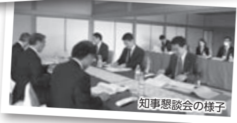
知事懇談会の様子