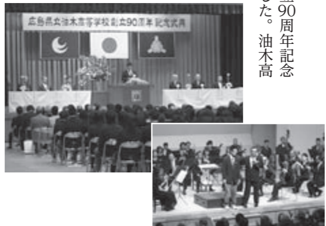
トピックス&ニュース

5月21日、広島県立油木高校の創立90周年記念式典が油木高校体育館で開催されました。油木高校は、大正11年5月15日に神石郡立神石農学校として開校し、卒業生は約13,000名を数えます。 式典では、在校生や教職員、来賓ら約400名が出席され、伝統を引き継ぐとともに今後のさらなる飛躍を誓われました。また式典終了後、さんわ総合センターで広島交響楽団による音楽鑑賞教室が行われ、広響の演奏にのせて全員で歌い上げた校歌が、ひととき誇らしく響き渡りました。