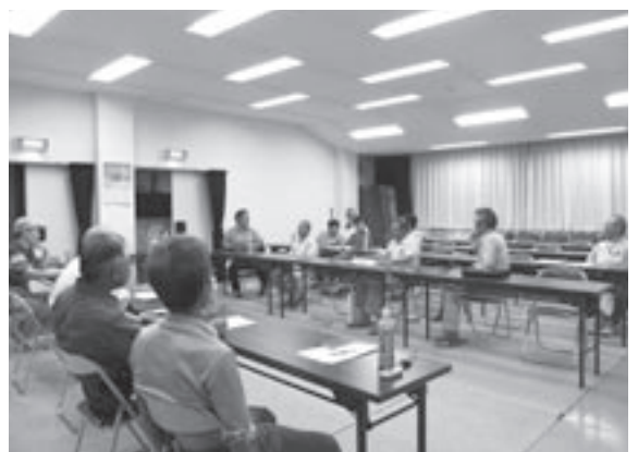
配置モデル候補地域「源流の里しんさか」役員会の参加風景

7月からは、隊員の配置モデル候補地域に伺って地域行事や自治振興会の役員会等にも参加する予定です。 まだまだ、未熟なことも多く勉強も必要ですが、皆様にご指導いただけるように頑張りますので宜しくお願い致します。