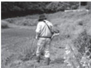
▲刈払機の使い方を実習中