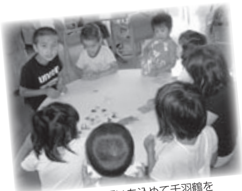
平和への願いを込めて千羽鶴を折っています

そして、今も世界のどこかで戦争やテロによって尊い命が奪われています。ヒロシマ・ナガサキの悲劇を二度と繰り返さないため、平和とは―。命とは―。私達にできることを考え、後世に伝え続けていくことが大切ではないでしょうか。