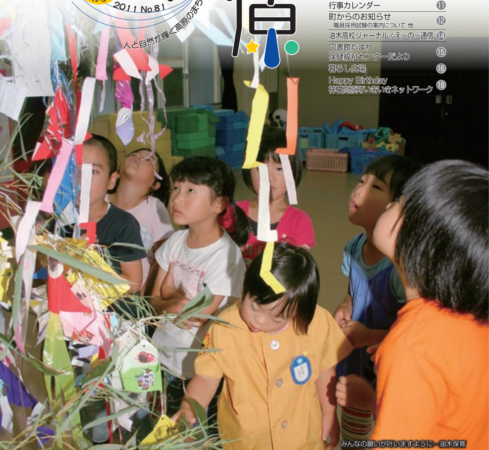
みんなの願いが叶いますように…油木保育