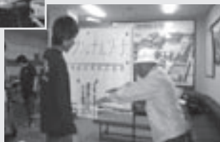
運動チェック リハビリ相談