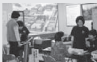
血管年齢測定・ 体成分分析測定