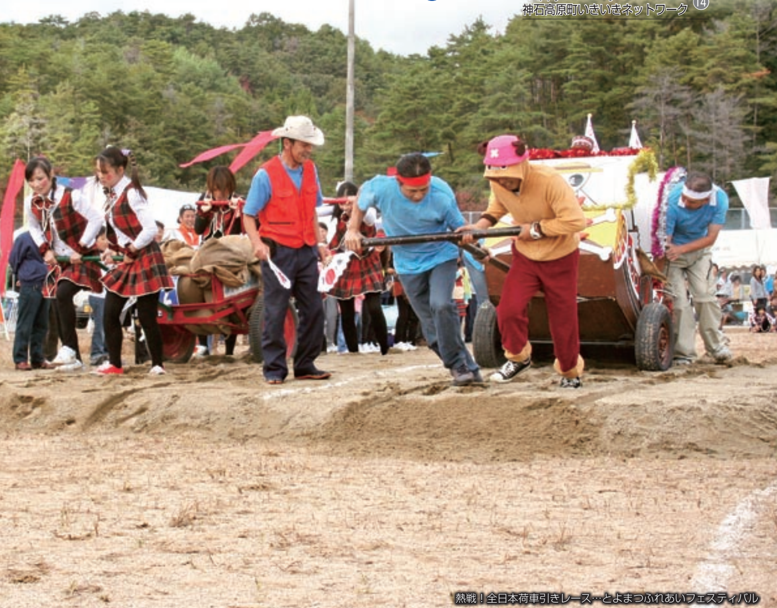
熱戦！全日本荷車引きレース…とよまつふれあいフェスティバル