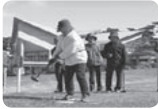
10月26日に行われた仙養ヶ原ふれあいの里でのグラウンドゴルフ大会の様子

神石高原かがやきネットでは、町内のさまざまなイベントなどを紹介する番組を放送しています。今月は、10月に開催された各イベントを紹介します。