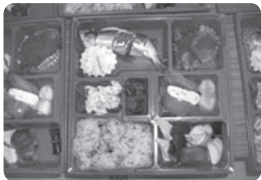
昨年10月に豊松で開催された日本山村会議で振る舞われた祭り料理

とともに絶やさず伝えていくこと。これは親から子への「バトン」ではないでしょうか。「食」を通して世代の超えた繋がりを持ちたいですね。