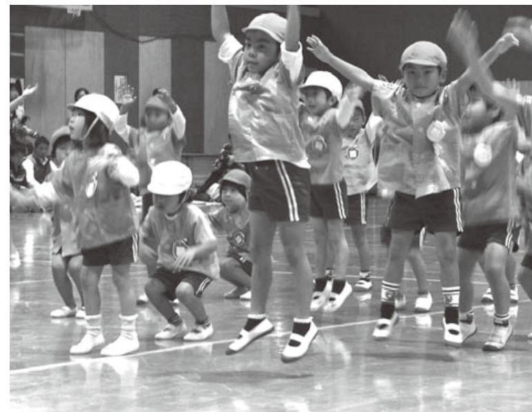
いづみ保育所運動会

議会の基本ルールであり、今日までの議会の取組みや、議会運営での決定事項を明文化した条例。