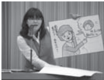
父木野自治振興会でのミニ講座の様子