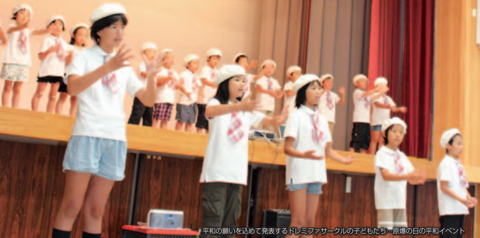
平和の願いを込めて発表するドレミファサークルの子どもたち…原爆の日の平和イベント