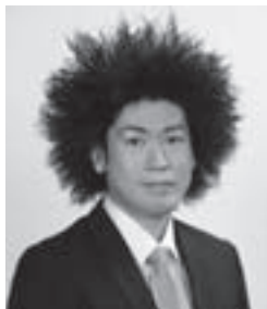
NHK「フックブックロー」出演中 でザ・ニューズペーパーに所属

皆さんが学校生活の間、いろいろな行事で『ひかりのそのさきへ』を歌っていただけだと思います。校歌ですが、校歌を越えた心の歌になってもらえたら嬉しいです。学校を卒業すれば、進学する人、就職する人、ふるさとに残る人、新しい町で生活する人。