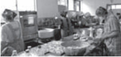
まきふれあい工房で試食会の準備

牧自治振興会では、安心して住める地域づくりのため、遊休化している公共施設「旧牧老人集会所」を農産物加工施設にリニューアルし、食を核とした地域交流・助け合いの場とする取り組みをされています。9月からの弁当販売に向けて、今年に入り地域の方々へのアンケートの実施、地域づくり先進地への視察、料理の試作を重ね、7月7日の美化活動にあわせ、まきふれあい工房(まきカフェ)プレオープン(試食会)を迎えました。当日は、地元食材を使った、弁当に入れるおかず中心のメニューをバイキング形式で試食し、大人から子ども約80人は笑顔で味わい、賑やかな試食会となりました。