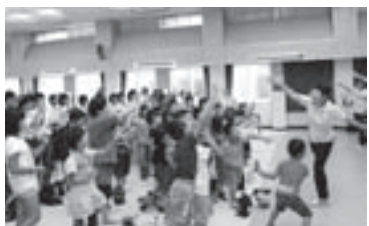
会場のみんなで平和の手遊び