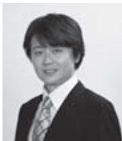
神石高原町観光大使で ザ・ニューズペーパーに所属

神石高原町のかわいい後輩のみんなが「自分の夢に向かって進んでほしい」という思いを込めました。