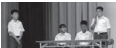
フィールドワーク体験発表