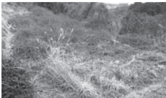
遊休地化した農地

あれば、農地所有者が農業委員会へ登録申請し地区指定・告示することにより、所有権移転可能な農地となります。登録条件は、当該農地が耕作されない農地または、今後遊休地化する恐れの高い農地で、空き家バンクに登録された空き家に付随する農地であることなどがあります。農地の登録は、指定様式により農業委員会へ申請が必要です。詳しくは、産業課内農業委員会へお問い合わせください。