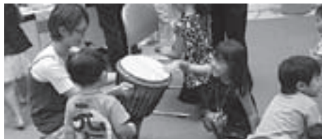
音と絵本のびっくり箱

今年もたくさんの方に参加いただきました！来年も楽しいイベントをたくさん用意してお待ちしています。