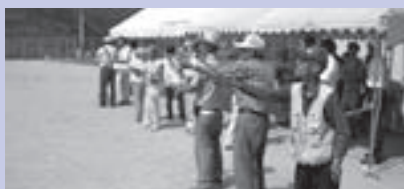
ロケット花火による追い払い演習

8月9日東部地区鳥獣被害対策集落リーダー養成講座の様子 (会場：さんわ総合センター) 県主催の講座に、近隣市町から約80人の参加者があり、イノシシ・サル・シカなどの生態を踏まえた農作物被害対策の基本知識を学んだあと、電気柵の設置演習やロケット花火による追い払い演習を行いました。