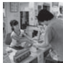
本の貸し出しに挑戦

子ども司書のおすすめ本が児童図書コーナーにPOP(子ども司書が作ったチラシ)と共に展示してあります。ぜひ読んでみてください！