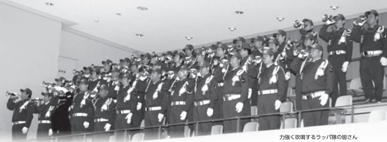
力強く吹鳴するラッパ隊の皆さん