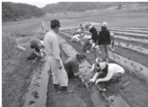
6月3日、植え付けの様子

耕作放棄地の解消は、神石高原町のみならず多くの地域で問題となっています。今回は地域の子どもたちと一緒に野菜を育てて収穫、そしてそれを食べることで農業に興味を持ってもらいたいと考えました。