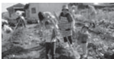
11月3日、立派なサツマイモができました

やっと収穫！思いのほか豊作で、子どもたちも大喜び。掘った芋はふかし芋にしてみんなで食べました。