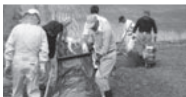
男性農業委員にも協力してもらって頑張りました

素材）を使って作業の効率化も試してみました。ガイド付きで作業は簡単ですが、耐久性が低くコスト高なのが難点でした。