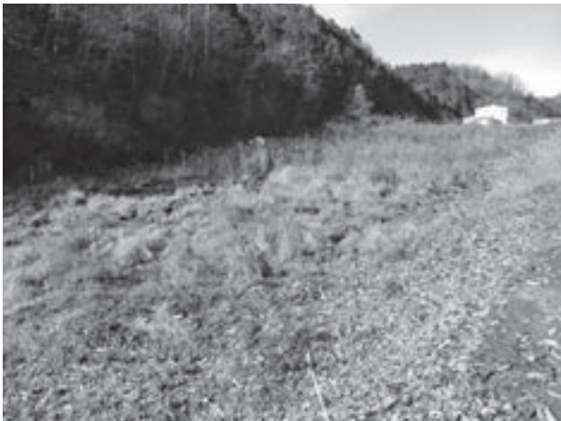
耕作放棄地化した農地

少子高齢化の中、神石高原町の基幹産業の農業はどうなるのでしょうか。今現在農業に従事されている皆さんの周りを見たとき、畑地には雑草・雑木が迫まり、圃場整備地区でさえ耕作放棄地が多く見られるようになりました。平成21年には農地法が大改正されました。この改正は地権者から耕作者への権利移動（自給率の低下、農地の荒廃の増加、後継者不足、などの防止のため）を大きな目的とし、また、農地の有効利用の徹底、優良農地の転用規制の厳格化を進めつつ、有力経営体への権利移行の規制緩和を目的としています。農地法改正により各関連法として、農業経営強化促進法、食料農業農村基本法、その他関連法が改正となりました。