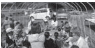
みんなで収穫したサツマイモはおいしいね

初めてのことで課題もいろいろありましたが、子どもたちに楽しんでもらえたことが何より良かったです。