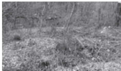
赤色 地目変更(変更登記)