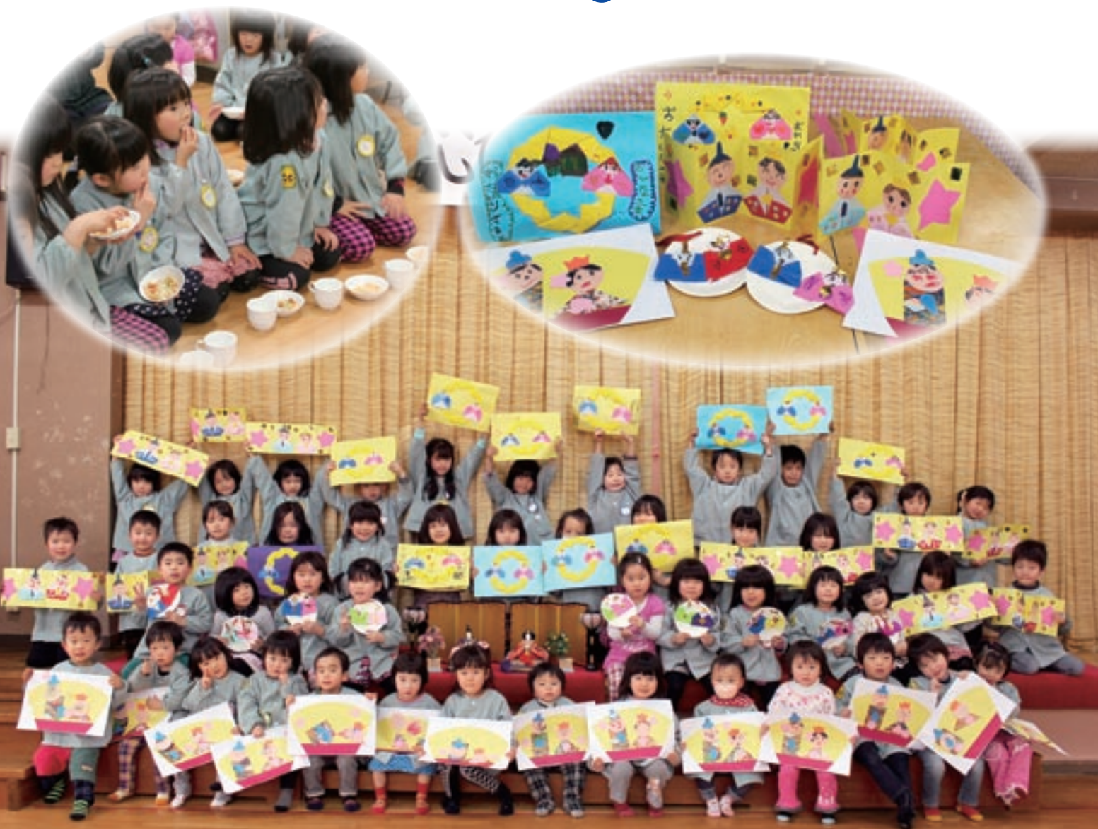
きょ〜うはたのしいひなまつり♪みんなでひなまつりをしたよ!…こばたけ保育所