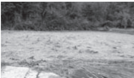
緑色 耕起で作付可能

この法律の改正により神石高原町農業委員会では、法律の目的に基づき、農地パトロールを行っています。その結果を文書と写真にまとめ、農地地図に反映していますが、この荒廃地調査は1筆調査で、町合併後は1委員の調査担当範囲が広く、農地の色分け（地目変更が必要：赤色、再生可能：黄色、耕起で作付可能：緑色）の決断も苦慮しつつ行っています。