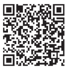
ふくやま美術館 ホームページ