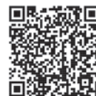
神辺文化会館 ホームページ