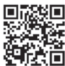
神石高原町 ホームページ