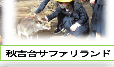
秋吉台サファリランド