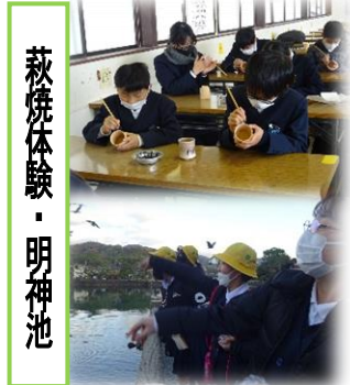
萩焼体験・明神池