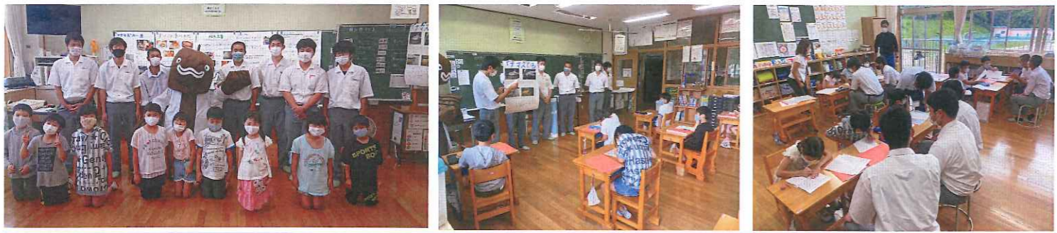
9/2 広島県議会 文教委員会 の視察を受けました！