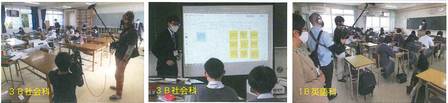
パソコンを使った授業の様子をNHK広島が取材に訪れ、放映されました！取材 9/30・10/6 放送 10/14