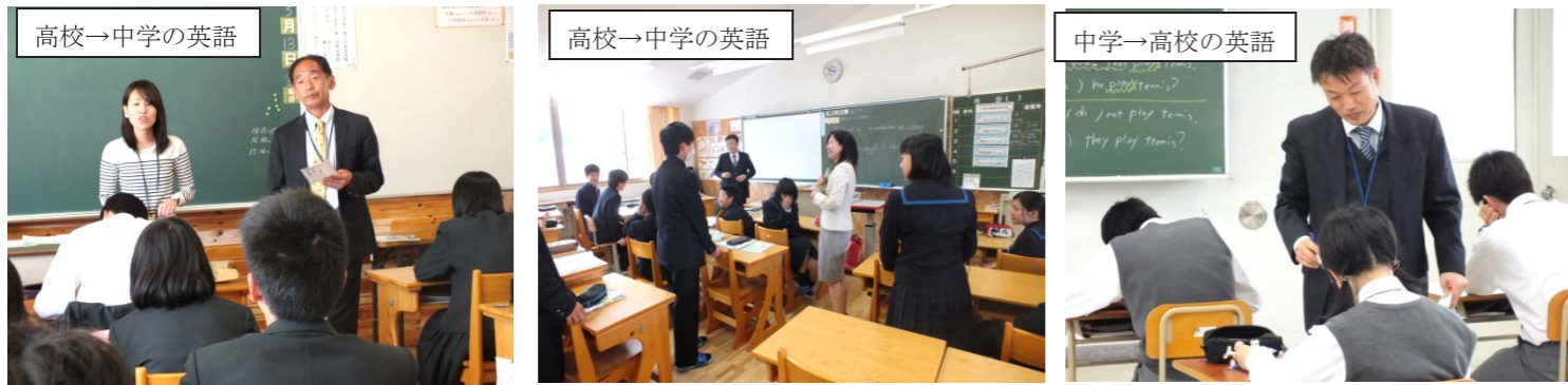
高校の英語科教諭(2人)が2中学校へ週5時間ずつ指導に行かれ、神石高原中の英語科教諭が油木高校へ週4時間行かれています。