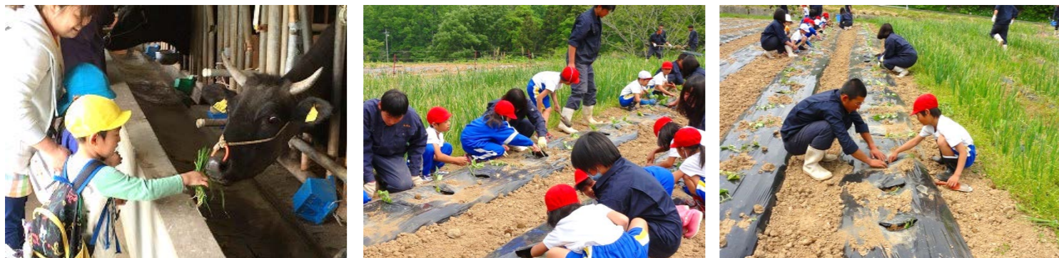
油木保育所の園児が牛舎見学