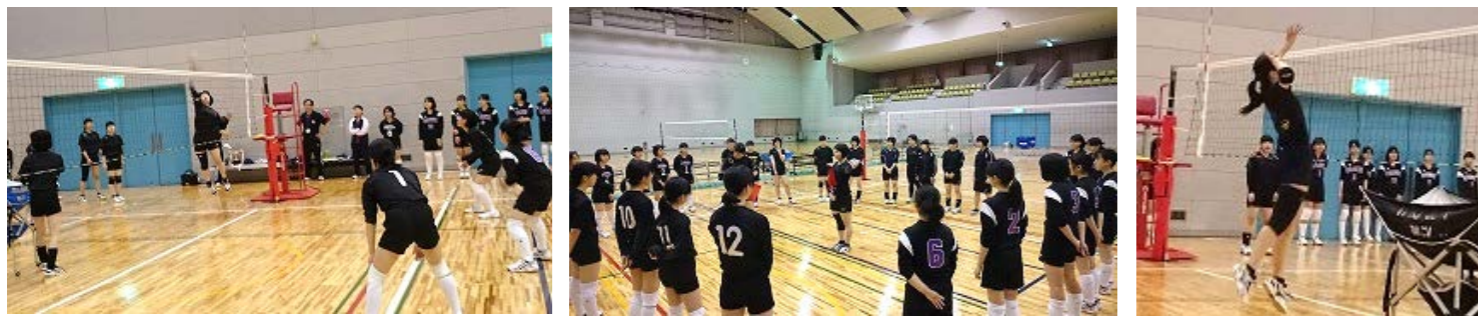
油木高校バレー部員が中学生の試合の審判・補助員として参加。試合終了後は、高校生から練習メニューや審判の仕方を学びました。