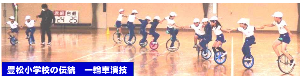
豊松小学校の伝統 一輪車演技

5月15日に陽光体育館で豊松小運動会を行いました。短い練習期間でしたが、児童は休憩時間も一輪車の練習をし、本番で輝けるようがんばりました。児童同士で「大丈夫。できるよ。」と励まし合う姿や5年生がリーダーシップを発揮して作戦を考える姿、係活動で責任を持って準備物を並べたり開・閉会式の運営をしたりする姿など、児童のかっこいい姿をたくさん見ることができ、成長を感じる一日でした。保護者の皆様、準備等ご協力いただきありがとうございました。