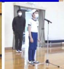
児童会長あいさつ