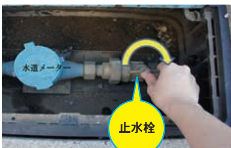
メーターボックス

★水道管などが破損した場合は、すぐにメーターボックス内の止水栓を閉め、直接、町指定の給水装置工事業者へご相談ください。