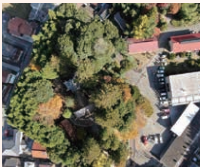
※この撮影は複数の監視と十分な安全配慮のもと行われました。