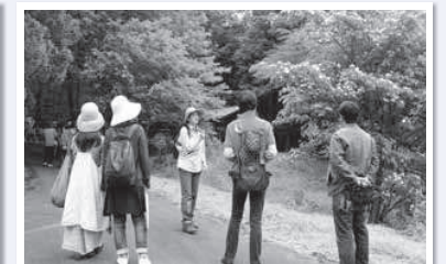
森林セラピープチ体験

町内には2つのエリア(帝釈峡・仙養ヶ原)に5つのコースがあります。普段何気なく歩かれているエリアをガイドと一緒に歩いてみませんか？詳しくは、神石高原町森林セラピーサイト