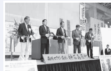
グランドオープンセレモニー テープカット

6月7日、ついに神石高原町の新しい魅力となる「神石高原町森林セラピー基地」がグランドオープンし、スコラ高原コスモドームで記念式典が開催され、本格始動しました。