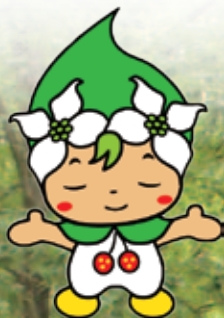
神石高原町森林セラピー基地 イメージキャラクター「ミズキ」ちゃん