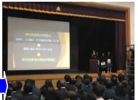
楽天 IT スクールの校内事業発表会(11/10)

(株)楽天と町の協力支援によって始まった「Rakuten IT School NEXT」に現在約15名の生徒が参加し、IT機器を活用しながら地域課題解決に向けて挑戦しています。放課後何回か検討会議を持ち、実践を重ねながら、今後その取組をまとめ、東京で成果発表の予定です。