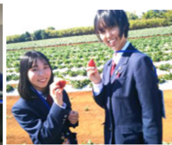
ストロベリー農場見学