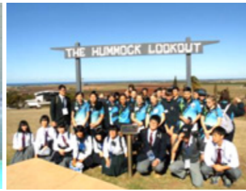
中高生合同の社会見学