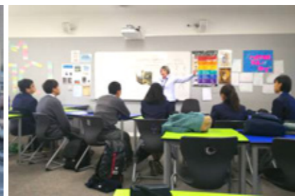
姉妹校で日本人のための英語授業