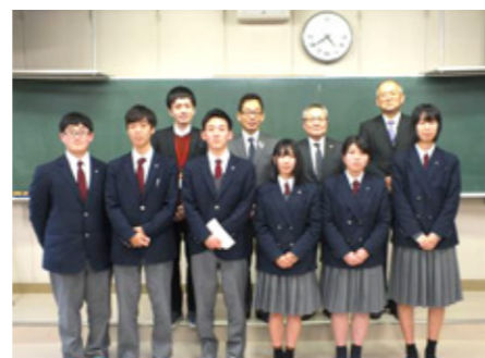
町長・教育長へ学びと感謝の報告会