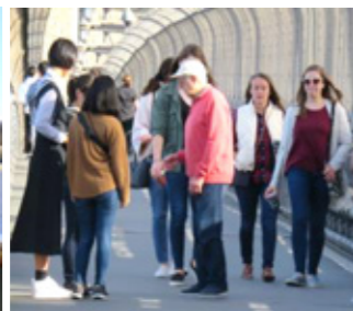
通行人に英会話の挑戦