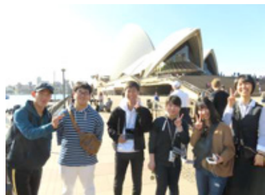
シドニーのオペラハウス前