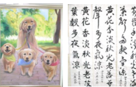
油木高校 美術部・書道部の作品展示