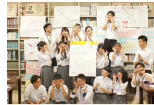
第1回「楽天 IT スクール NEXT」開催（8月）