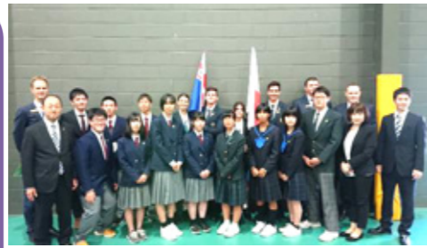
歓迎式典後の記念撮影