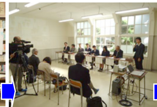
ドローンアカデミー記者発表(11/1)