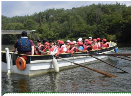
カッター活動 声が出るようになると、カッターも進むように…