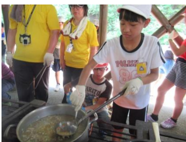
野外炊事 暑さとの戦い！ススとの戦い！ 諦めません 最後まで！！