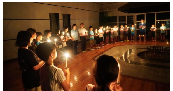
キャンプファイヤー 感動！！