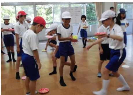
仲間づくりタイム まだ、表情は硬め

4日間で様々な体験をした子どもたち。豊松小の4人も自分の目標を意識し、自分のことだけでなく、周りの人のことや先のことを考えて行動することをがんばっていました。迎えに来てくださった家族に「ただいま」の報告をする時、4人とも「目標を達成できました。その訳は…」と話していました。いつもとは違う環境の中で目標を持ってがんばり、成長したことを実感できたからでしょう。大きく成長した4日間となりました。