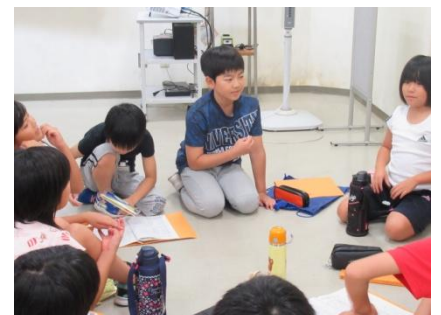
スタンプ練習 意見を出し合い、楽しい出し物にするように…