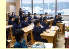
中学校の授業体験