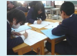
主体性・思考力の育成