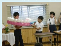
保健給食委員会の活動