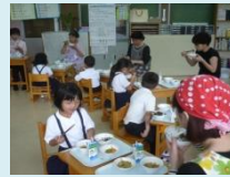
食事のマナー 残菜ゼロ