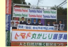
とよまつふれあい フェスティバル