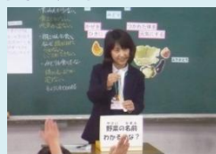
各教科・領域に関連した指導