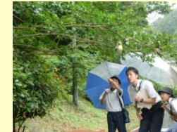
モリアオガエルの 卵の観察