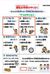
豊松小学校 7つのやくそく