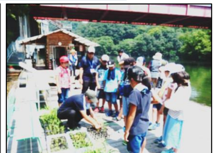
神龍湖（空心菜栽培）