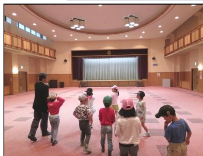
神石協働支援センター