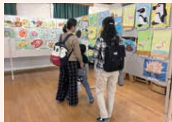
両町の小学2年児童による 生きもの絵の展示

神石高原町からマイクロバスを手配したところ、多数の参加をいただきました。会場では両町の小学2年生が描いた絵の展示や、発砲スチロールで動物や昆虫などの立体オブジェ制作体験などもありました。会場入口ではピースウィングズ・ジャパンが里親を待っている犬の譲渡会を行いました。また、引退した競走馬の命を救う取り組みをしている岡山乗馬倶楽部内には多くの馬が第2の馬生を送っており、参加した子どもたちは1日じっくりと触れ合い楽しんでいました。