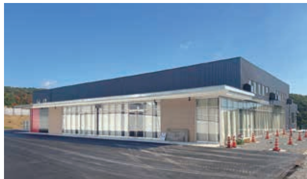
工事中の産直市場(11月1日撮影)