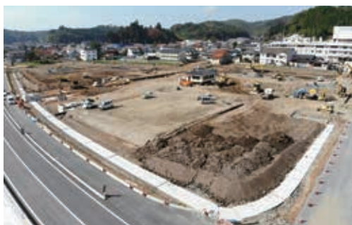
(令和元年10月30日撮影)

よび新町立病院の建設に向けて敷地造成工事を進めています。工事の進捗状況についてお知らせします。