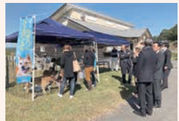
ピースウィングズ・ジャパンの 犬の譲渡会