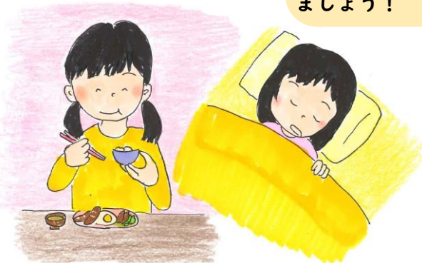
きそくただ せいかつ

お茶を飲む時・体育の時・給食の時以外はできるだけマスクをつけましょう。外すときは距離を開けよう!