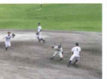
力強い応援に選手たちも力が入ります！