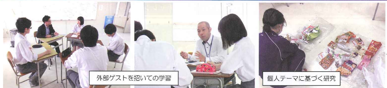
外部ゲストを招いての学習