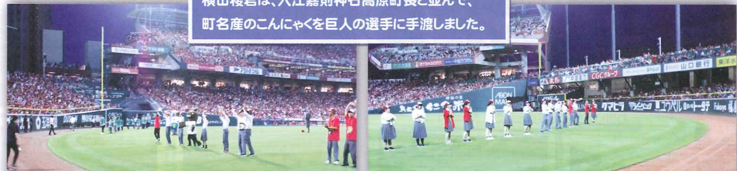
7月20日(土)は今年もマツダスタジアムで、油木高校産業ビジネス科が取り組んでいるナマズ養殖のアピールをさせていただくことができました！また「神石高原町 PR デー」ということで、町からも特産品の「神石牛」や「トマト」が販売され、たくさんの来場者にそのおいしさを知っていただく機会となりました！