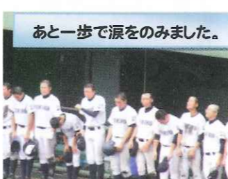
あと一歩で涙のみました。