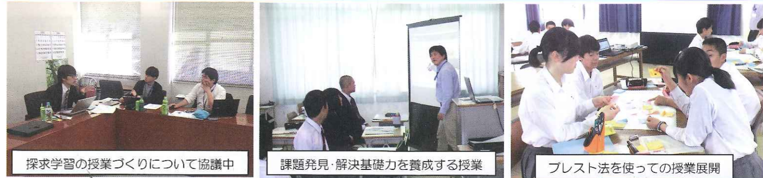
探求学習の授業づくりについて協議中