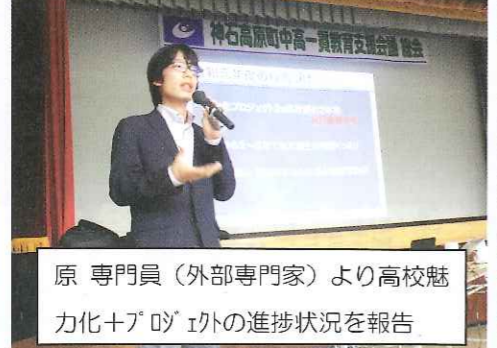
原 専門員（外部専門家）より高校魅力化+7+D+E以外の進捗状況を報告