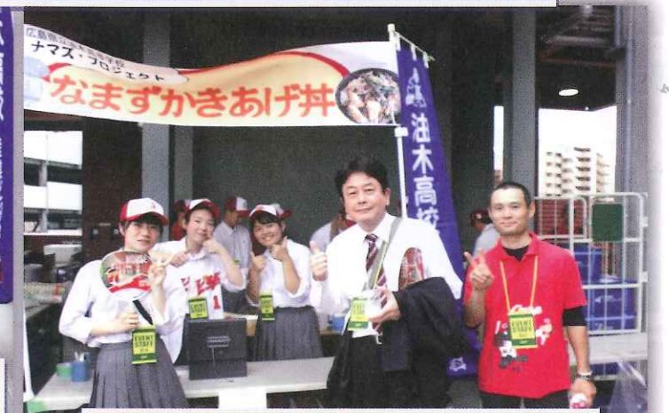
なまずかき揚げ丼の販売！約 400 食を完売！