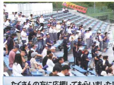
たくさんの方に応援してもらいました！