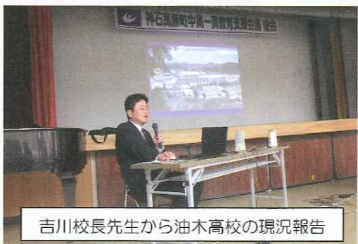
吉川校長先生から油木高校の現況報告