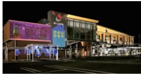
本庁舎をプロジェクションマッピング