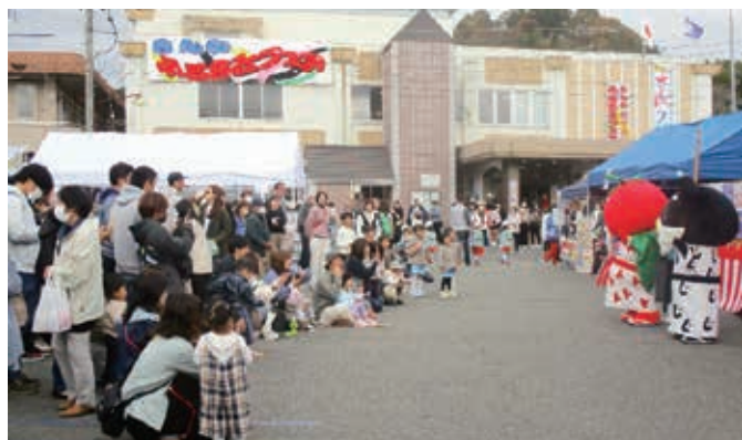
さんわふるさとフェア(来場者数 約1000人)

集落内で拡がり続ける耕作放棄地や荒廃農地は猪などの棲み家となり、近隣の農作物への被害も深刻さを増してきています。三和地区では、放置された荒廃地を集落全体で整備される場合、m当たり45円の助成金交付事業とし、自治振興会毎の上限額を設けざるを得ないほどに、好評をいただき事業実施されています。