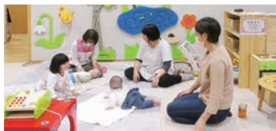
おひさま広場(地域子育て支援拠点)

てに関する業務を一元化し「子育て応援課」1課で対応している。多くの情報共有が図られ、子育て世帯との繋がりを大切にするなかでより密度の高い行政サービスに繋がっている。本年度「子育て支援プロジェクトチーム」を立ち上げ「第3次長期総合計画」「第3期総合戦略」の策定に先立ち、子育て支援の拡充を1年前倒しでスタートしたい。