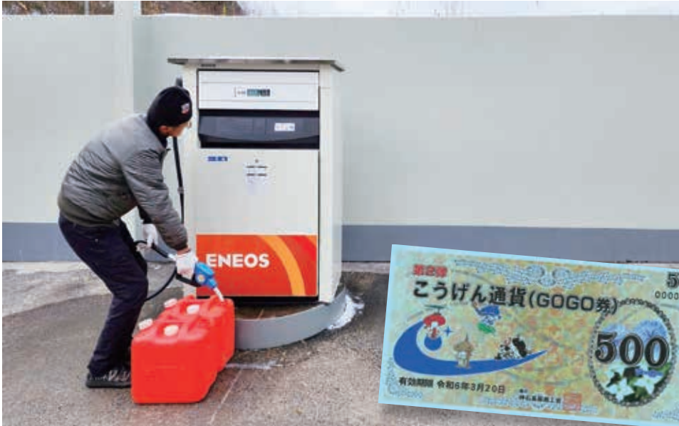
2000円給油で500円の地域通貨券(GOGO券)

握している。国の方針で、非課税世帯であっても課税者に扶養されている世帯は対象外となる。調査基準日は令和5年12月1日である。