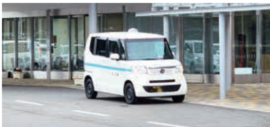
ふれあいタクシーでの通院

ふれあいタクシーの病院への通院について、料金改正など、サービスの向上が出来るものは検討していきたい。