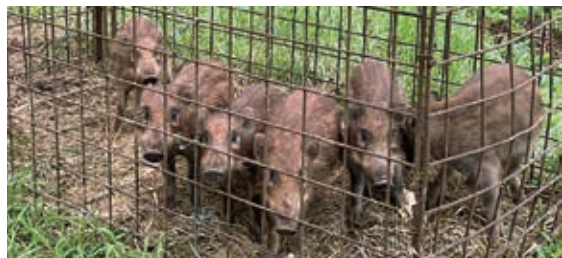
箱わなで捕獲されたウリ坊

第5期有害鳥獣被害防止計画(令和2年(令和4年)による有害鳥獣捕獲活動の個体数調整、被害防除、研修会での生息環境管理の成果と被害防止計画の目標達成状況は。