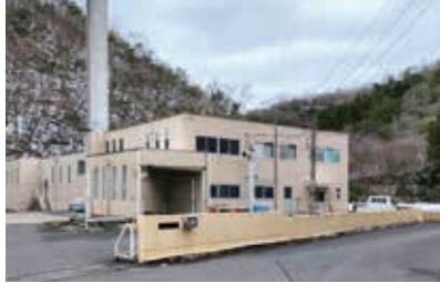
築後45年経過し、老朽化が進む処理場

問 町内に18カ所地元管の給水施設がある。50数年経過した施設もあり、更新が必要だが、指導・支援すべきでは。