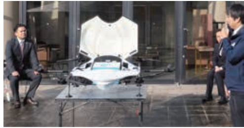
ドローンでの配送

ための実装の可能性を探る段階と考えている。今後は、事業の内容を見極めながら進める。