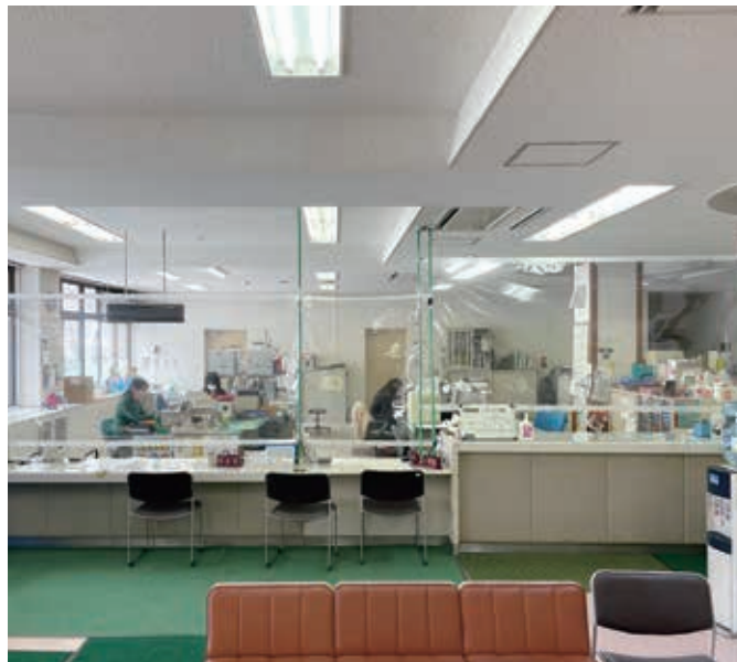
リニューアル予定の神石支所