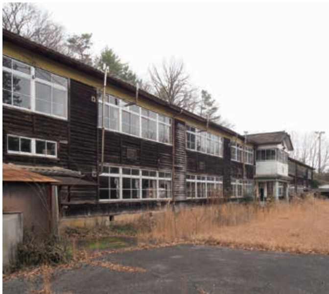
平成4年に廃校となった新坂小学校