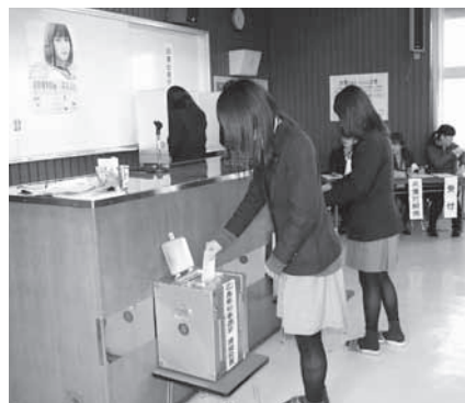
大切な1票を投票箱へ