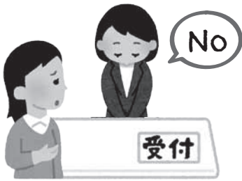
(例) 聴覚障害があるため筆談を依頼したのに断られた。知的障害があるのに分かりやすい説明をしてくれなかった。