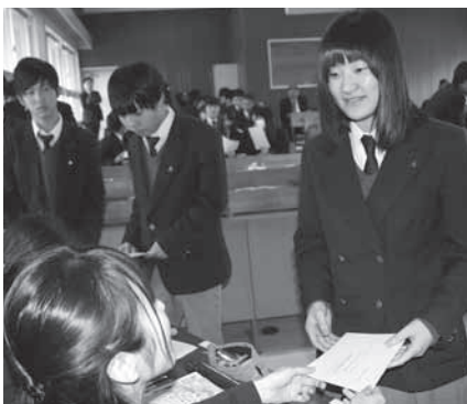
本人確認を終え投票用紙を受け取る生徒