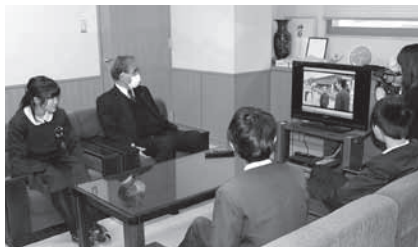
CMを視聴する町長と児童たち

三和小学校6年生は、総合的な学習で地元の特産ブランドである「神石牛」について今年度学習してきました。おいしい神石牛を多くの方に知っていただき