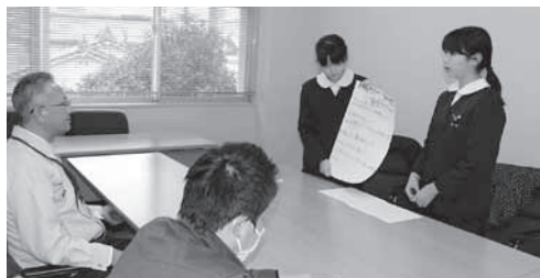
見学ツアーを説明する児童たち

食べてもらうためのプロジェクトの一環として、(株)ケーブル・ジョイ協力のもとCM「みんなでたべよう神石牛」を作成し町へ寄贈しました。また、神石牛を含め、町の魅力を体験してもらうための、「神石高原町三和地区まると見学ツアー」と題したプランを自分たちが考案し、町へ提言しました。今後、CMについては、神石高原かがやきネットやウェブを利用してPRしていきます。郷土愛あふれる児童たちの提言をもとに、更なる町の活性化に向けての取り組みが期待されます。